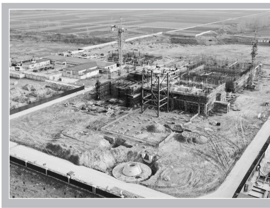
高新区认真落实“要素跟着项目走”机制,提前谋划好土地、能耗、资金等要素,促进重点项目与政策体系的精准匹配和衔接平衡。对全区接续续建的43个重点项目精准施策,做到一个项目、一个工作班子、一个施工方案、一个推进计划、一个时间表,重点推动早日复工,争取把耽误的工期补回来。因为正在建设中的菏泽锦江环保能源有限公司迁建(一期)项目。

按照“走访不漏户、户户见干部”地毯式排查工作的要求,进一步精准掌握辖区内农户“一达标、两不愁、三保障”和产业发展需求、生产就业、帮扶政策落实、危房改造、疫情防控、学生网课收看等方面的情况;重点关注全镇临界户、特殊困难群体、低保户、五保户、残疾户、大病户、老人户的家庭情况及诉求。按照日调度、日研判的工作模式,包村干部每日汇报走访情况,围绕“一达标、两不愁、三保障”及满意度实行“户户过”,针对存在问题,及时研究解决,做到边查边补,明确责任人和完成时限,确保在2020年3月底前全面完成补短工作。