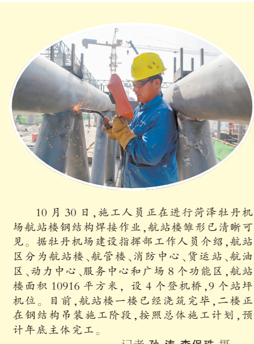
10月30日,施工人员进行菏泽牡丹机场航站楼钢结构焊接作业,航站楼雏形已清晰可见。据牡丹机场建设指挥部工作人员介绍,航站区分航站楼、航管楼、消防中心、货运站、航油区、动力中心、服务中心和广场8个功能区,航站楼面积10916平方米,设4个登机桥,9个站坪机位。目前,航站楼一楼已经浇筑完毕,二楼正在钢结构吊装施工阶段,按照总体施工计划,预计年底主体完工。

国有资产监督管理情况综合报告和行政事业性国有资产监督管理情况专项报告、环境状况和环境保护目标完成情况报告、现代商贸物流产业发展情况报告、安全生产“一法一条例”执法检查情况、2019年上半年国民经济和社会发展计划执行情况报告、2018年财政决算和2019年上半年预算执行情况报告、2018年度市级预算执行和其他财政收支审计工作报告等8项审议意见研究处理情况的报告;《菏泽市人民代表大会常务委员会会议事规则(修订草案)》《菏泽市人大常委会跟踪督办暂行办法(修订草案)》《菏泽市人大机关信访工作办法(草案)》《菏泽市人大代表大会代表建议、批评和意见办理办法(修订草案)》等4项制度。会议还表决通过了有关人事任免事项。根据菏泽市人大常委会人事任免办法的规定,尹玉明向新任人员颁发了任命书。根据《全国人民代表大会常务委关于实行宪法宣誓制度的决定》《山东省实施宪法宣誓制度办法》的有关规定,会议组织新任人员进行了宪法宣誓。