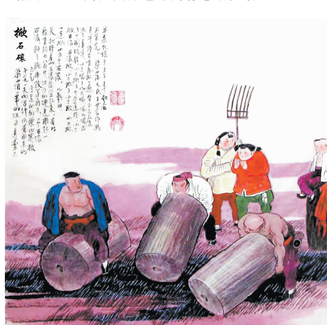
文/丁明烨 画/王世会

农村的夜晚祥和静谧,一轮圆月高高地挂在天边,洒下如水月华,渲染着夜色柔美。吃完晚饭,乡