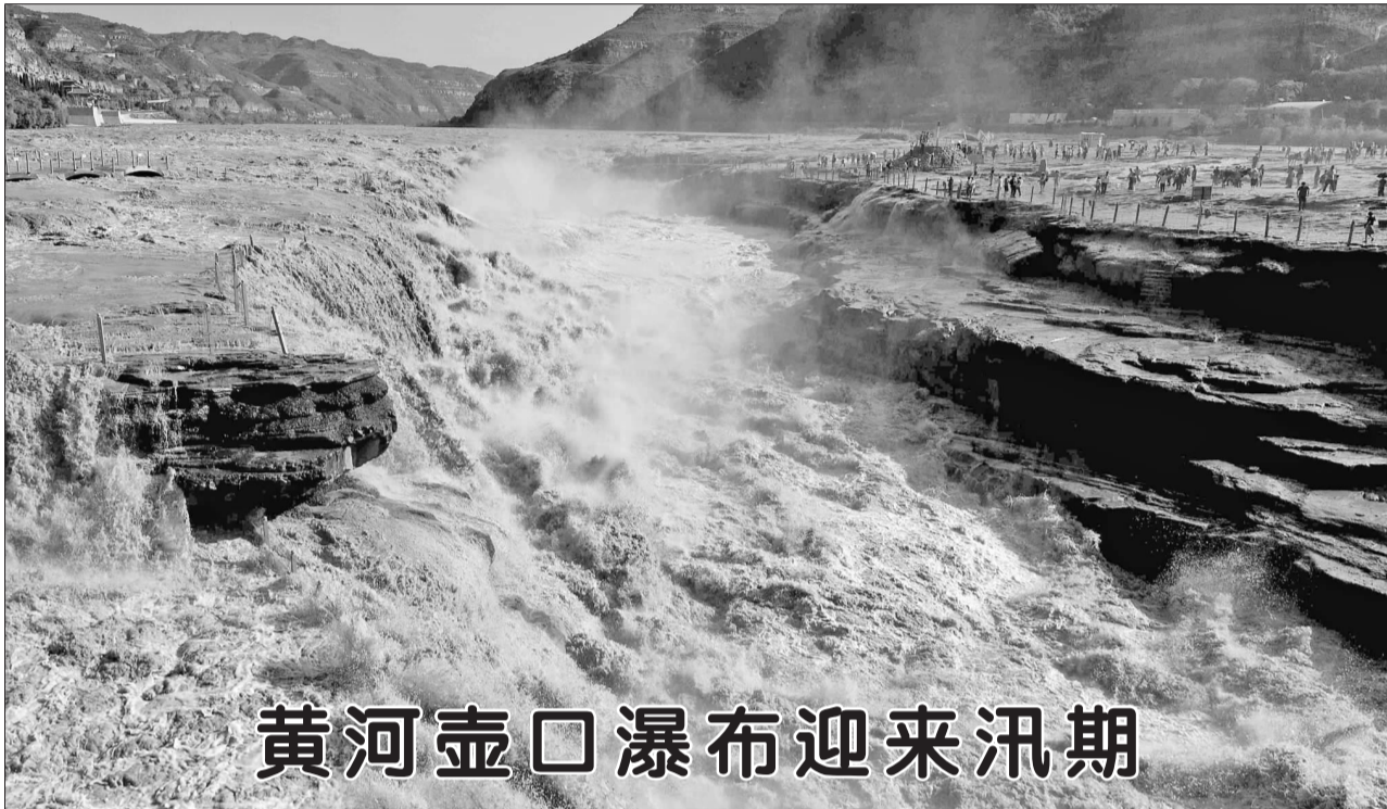
黄河壶口瀑布迎来汛期

现场嘉宾对李克强的致辞多次致以热烈掌声。致辞后,李克强还就中国宏观经济发展回答了提问。世界经济论坛主席施瓦布和保加利亚总统拉德夫、孟加拉国总理哈西娜、格鲁吉亚总理巴赫塔泽等政要,以及来自100多个国家和地区的各界代表1900余人与会。