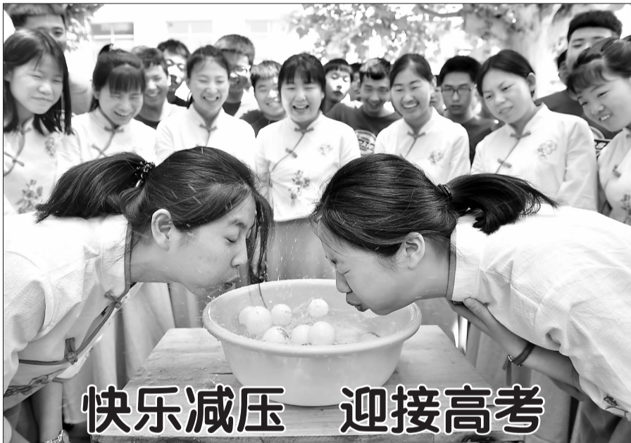
快乐减压 迎接高考