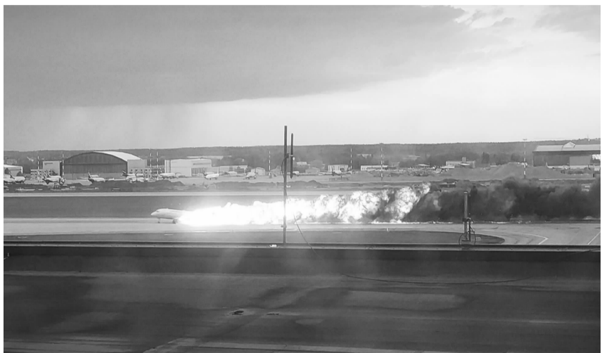
5月5日，一架客机在俄罗斯首都莫斯科谢列梅捷沃机场迫降后烧毁的客机残骸。俄罗斯官方机构5日表示，当天在莫斯科谢列梅捷沃机场迫降后烧毁的客机共载有78人，其中41人遇难，37人生还。

新华社莫斯科5月6日电 俄罗斯联邦航空运输局5日晚间表示，目前正在调查俄当地时间5日晚飞机失事的原因，任何结论都为时尚早。俄罗斯联邦调查委员会当天也发布公报说，该机构已向谢列梅捷沃机场派遣刑侦人员调查事故原因。