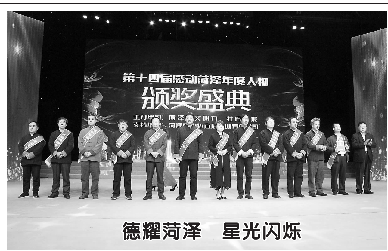
德耀菏泽 星光闪烁

据悉,被列入经营异常名录的企业,在政府采购、工程招投标、国有土地出让、授予荣誉称号、办理银行贷款、工商登记等工作中,将依法受到限制或禁止。被列入黑名单的企业法定代表人、负责人,3年内不得担任其他企业的法定代表人、负责人。上述情形均会通过国家企业信用信息公示系统(山东)向社会进行公示,实施信用约束和联合惩戒。