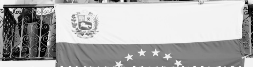
1月23日,在委内瑞拉加拉加斯,委总统马杜罗(中)在参加群众集会时挥舞国旗。马杜罗当日宣布,委内瑞拉正式与美国断交。

她表示,中方一贯奉行不干涉别国内政原则,反对外部干预委内瑞拉事务,希望国际社会共同为此创造有利条件。