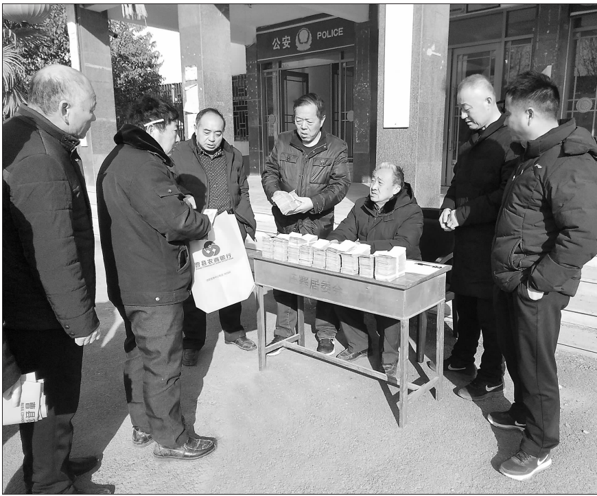
1月21日,庄寨镇庄寨村村委会为全村群众发放元月份的“福利”,而这项工作该村已坚持了32年。近年来,庄寨村大力发展商贸物流业,带动了村经济增长点。该村每月为群众每人发放300元的“福利”,为村内55岁至60岁以上的老人每人每月再加50元,为村民的生活保障提供了有力支撑。

针对辖区内适龄青年外出务工多、流动性大的特点,县人武部采取集中设站与流动设站相结合、报名登记与主动上门登记相结合、本人登记与家长代登相结合的方法,要求基层专武干部对所有报名登记的适龄青年及代登家长进行面对面交流,讲清兵役登记的意义及国家现行的兵役政策规定,实行零距离登记,力求登记信息准确规范,确保不漏登、不错登。并对已登记确定为预征对象人员加强管理,做到现实表现清楚、家庭情况清楚、身体情况清楚、文化程度清楚,外出去向清楚。对在外务工人员进行动态管控,建立双向联系制度,确保征兵工作开始后,能够“联得上、召得回”。