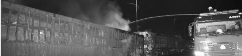
现已初步查明,发生爆燃事故是由于

11月30日,河北省张家口市召开“11·28”爆燃事故新闻发布会通报事故原因初步调查结果