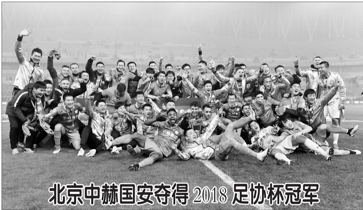
北京中赫国安夺得2018足协杯冠军

据了解,应急管理部赴河北省张家口市“11·28”爆燃事故工作组指导协助地方事故调查组,通过勘查现场、查阅资料、调取参数和视频,询问有关人员、组织专家开展技术分析,初步查明事故直接原因是中国化工集团河北盛华化工有限公司氯乙烷气柜发生泄漏,泄漏的氯乙烷扩散到厂区外公路上,遇明火发生爆燃,导致停放公路两侧等候卸货车辆的司机等23人死亡、22人受伤。事故的详细原因,河北省人民政府事故调查组将做进一步的调查。