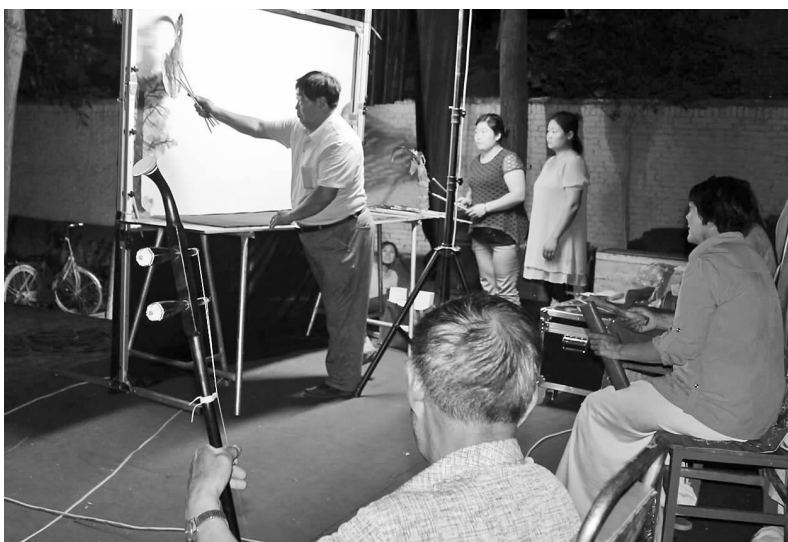
▲端午佳节期间,国家级非物质文化遗产定陶皮影艺术团来到张湾镇庄村演出《火云洞》和移风易俗短片,让老百姓在忙碌的闲暇时间,也能过一把戏瘾。