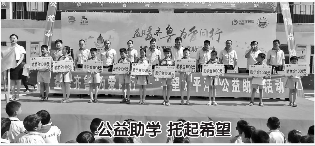
公益助学 托起希望

如今,以桑园为中心,麦冬种植辐射周边姚付庄、王善庄、高李庄等20多个村,并扩展到邻近的大集、青堌集、作楼、孙老家等乡镇,种植面积达11000余亩,发展种植大户15家,带动周边800多农户种植,户均增收4500余元,产品远销亳州、保定、广州等地,形成了集产、供、销于一体的产业链。