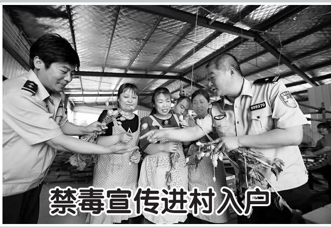
禁毒宣传进村入户

▲5月27日,“益暖齐鲁为爱同行”希望太平洋公益助学活动在曹县常乐集镇中心小学举行,太平洋寿险菏泽市中心支公司为该校捐赠助学金1万元和价值2万元的图书。曹县常乐集镇中心小学是菏泽市唯一受到捐助的学校。