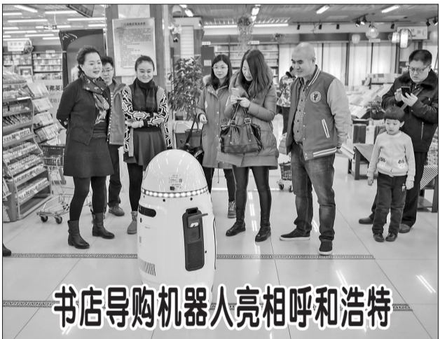
书店导购机器人亮相呼和浩特

这是济南市政府19日召开新闻发布会宣布的。据了解,大明湖是济南三大名胜之一,为山东省级风景名胜区、国家重点公园、国家5A级旅游景区,1955年正式辟建为公园,1957年5月实行售票游园,目前已与扬州瘦西湖、匈牙利蒂萨湖结为姊妹景区。