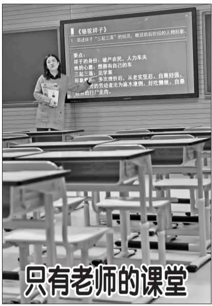
12月19日,北京二中的刘老师在网络直播室直播语文课。

△ 12月19日,北京二中的刘老师在网络直播室直播语文课。当日至21日,北京二中在重污染红色预警弹性停课期间,利用4G网络直播教室资源,让学生在家长收看老师在学校直播室内的教学。共有18名教师参与直播36节课程。据介绍,直播的课程均由各课组长、骨干教师承担。