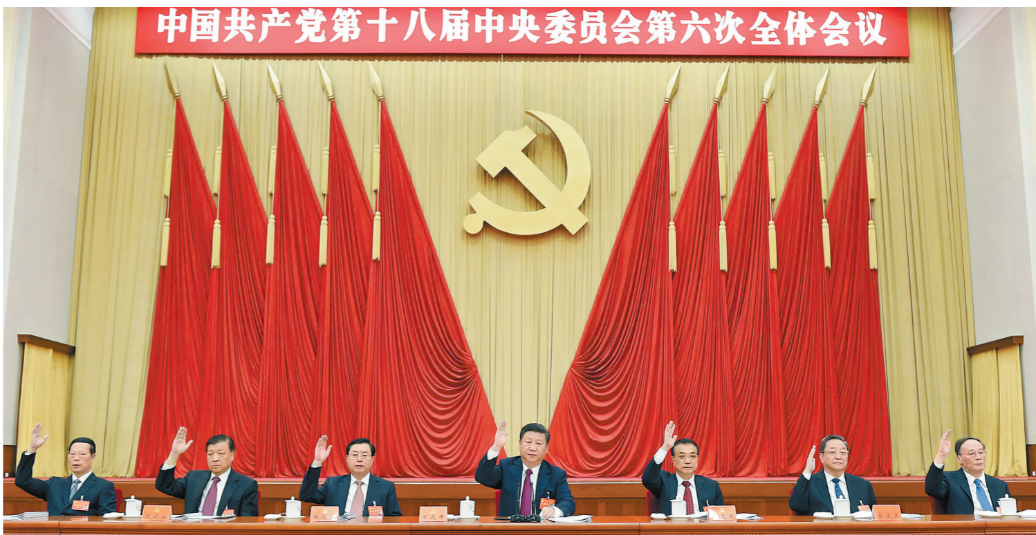
中国共产党第十八届中央委员会第六次全体会议,于2016年10月24日至27日在北京举行。这是习近平、李克强、张德江、俞正声、刘云山、王岐山、张高丽等在主席台上。