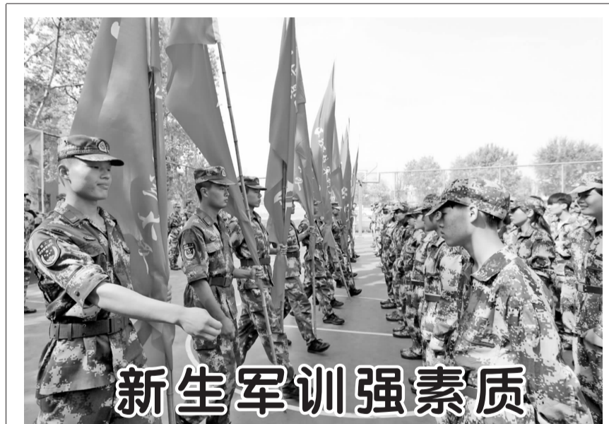
新生军训强素质 9月23日,菏泽信息工程学校举行2016秋季新生军训动员大会,拉开了秋季新生军训的序幕。菏泽信息工程学校十分重视学生综合素质的培养,把军训与学生的素质教育结合起来,当作新生入学的必修课程,通过军训让学生锻炼体格,磨炼意志,增强纪律观念,全面发展,为今后的学习和生活打下坚实的基础。图为军训动员大会授旗仪式。