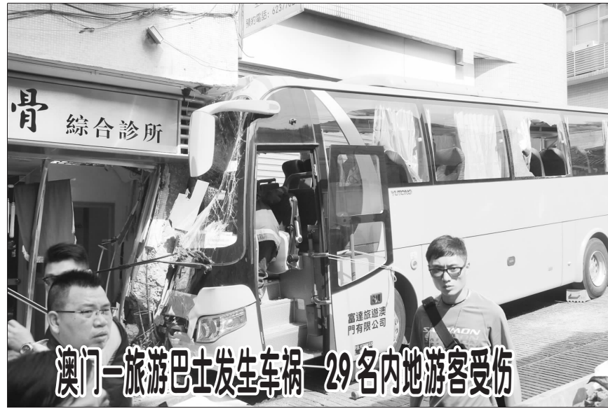
澳门一旅游巴士发生车祸 29名内地游客受伤