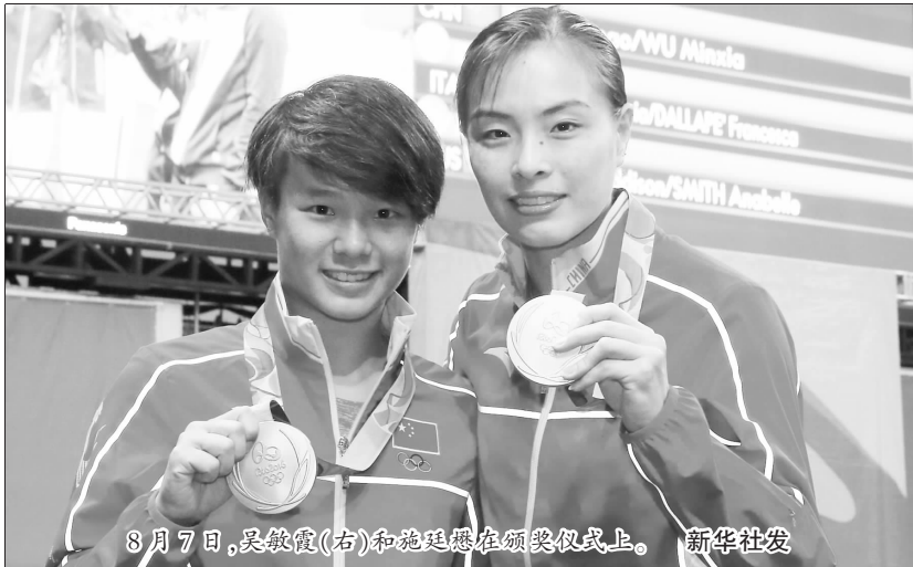
8月7日,吴敏霞(右)和施廷懋在颁奖仪式上。

对于自己成为传奇人物,超越郭晶晶的纪录,吴敏霞并不在意:“郭姐永远是郭姐。郭晶晶对我的成长非常重要,帮助非常大,她一直是我的大姐姐,一直在帮助我,在比赛和生活中照顾我,让我慢慢成长起来。不管我是否在成绩上超越她,她一直是我的‘郭姐’,这一点从来不会变。”