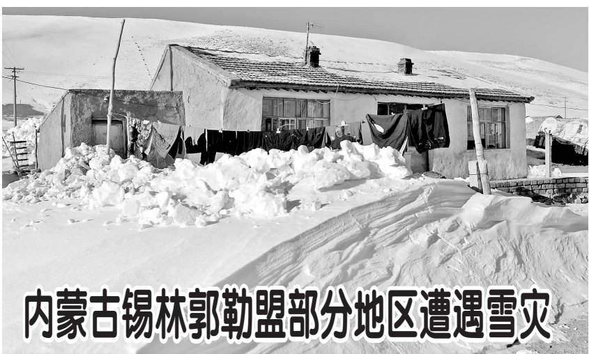
内蒙古锡林郭勒盟部分地区遭遇雪灾

在近期京津冀及周边地区发生严重污染天气后,环保部华东督查中心立即对山东省部分城市开展了重污染天气应急响应督查工作。从督查情况看,德州市主要存在三方面问题:一是预警预测能力薄弱,预测结果偏差巨大,德州市预测11月29日、30日空气质量将好转,但实际上两天均为严重污染;二是应急工作教条化,未及时采取有效应对措施,在29日、30日均为严重污染的情况下,仍未能及时应变,提升应急响应等级,一直维持在最低的蓝色预警级别,未采取任何实际减排措施应对严重的空气污染;三是应急预案针对性不强,措施乏力,德州市今年新修订的预案与老应急预案相比,在应急减排措施力度上大幅退步。