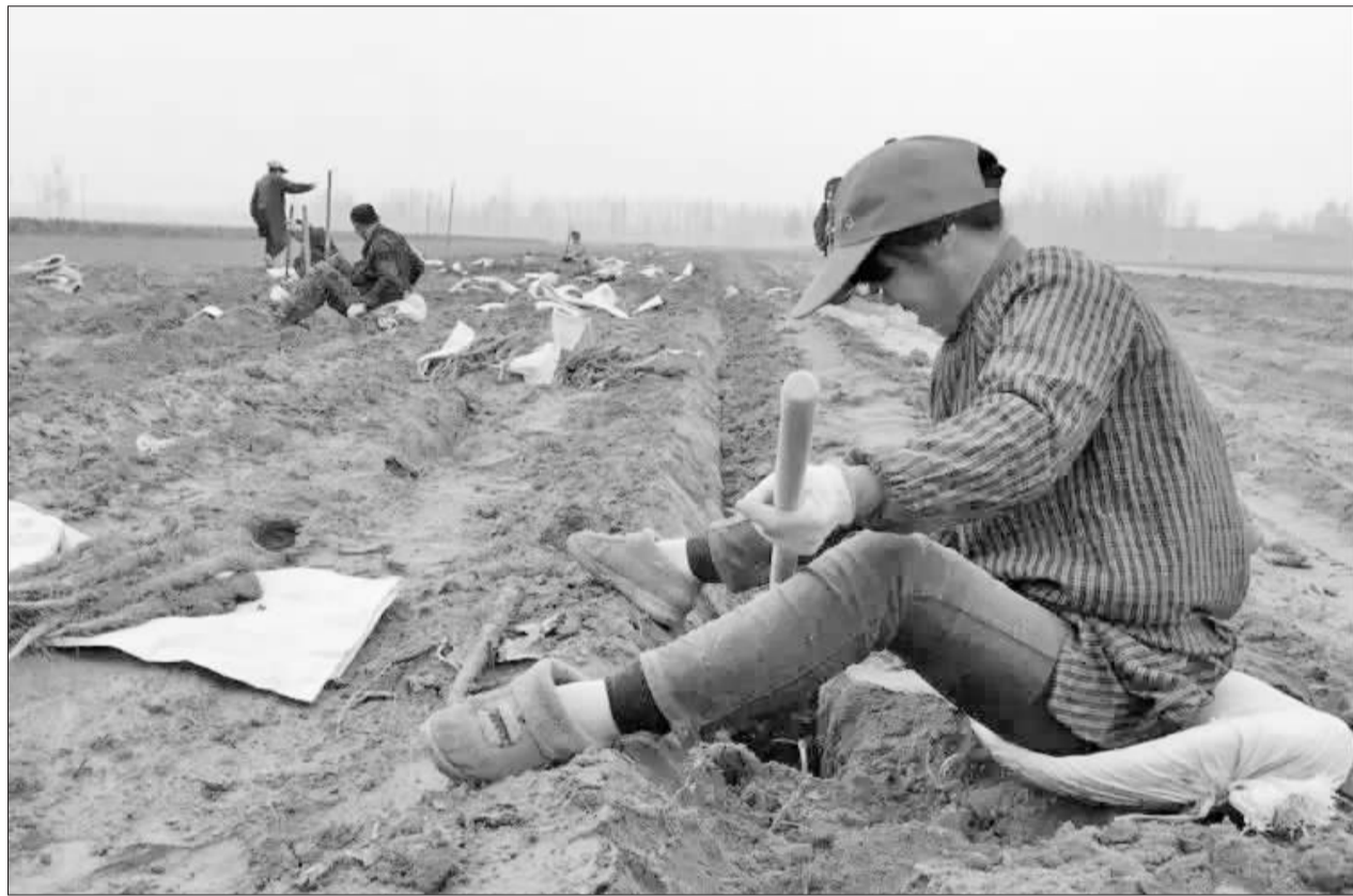
11月10日,定陶县半堤镇立新村农民正在家门口的山药地里挖山药。据了解,眼下正是山药收获季节,今年山药亩均产量在2000斤左右,每斤批发价5元,纯收益在7000元左右。山药种植大户选择雇用本村或邻村的富余劳动力帮助收获,打工者一天的收入在100多元。

传染病人的心理压力比较大,对他们进行疏导,在救治中显得十分重要。李蕊深深明白这个道理。平日中,李蕊经常自掏腰包,为经济条件差的病人买饭捐物,解决他们的生活问题。有时还买来水