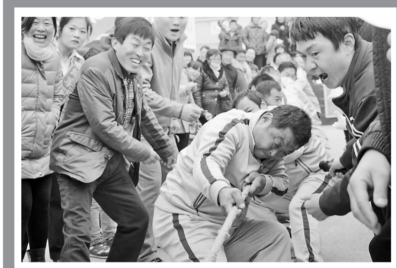
日前,成武县经济开发区举办“盛世杯”农民秧歌舞、拔河大赛。全区18个代表队参加比赛。据了解,为进一步丰富广大人民群众精神文化生活,今年以来,开发区党工委、管委会从文化建设抓起,党员干部与百姓同登一个舞台演出,同欢乐,齐健身,拉近了党群干群之间的友谊和距离。