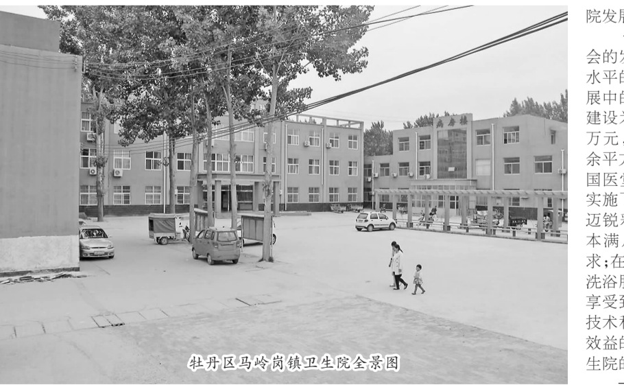
牡丹区马岭岗镇卫生院全景图