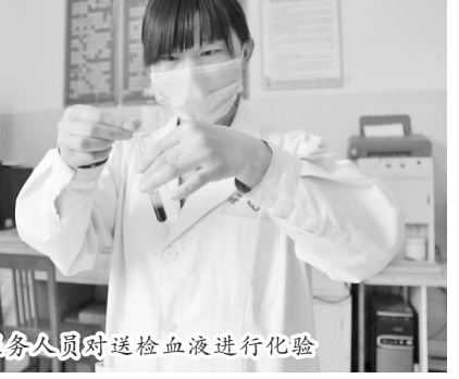
化验室医务人员对送检血液进行化验