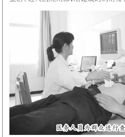
医务人员为群众进行查体

走进综合楼,只见检验室、儿童洗浴室、手术室、门诊室一应俱全。检验室内配备有全自动生化分析仪、迈锐彩色多普勒、彩超等先进仪器。来到拍片室,CT等大型医疗设备为解决百姓就医难提供了保障。来到病房,医护人员正在给患者扎针输液,白色的墙壁、白色的床单,不再是简单的寒喧,每个人脸上的透露的是医患之间的和谐与信任,让患者暂时忘却了疾病的困扰。